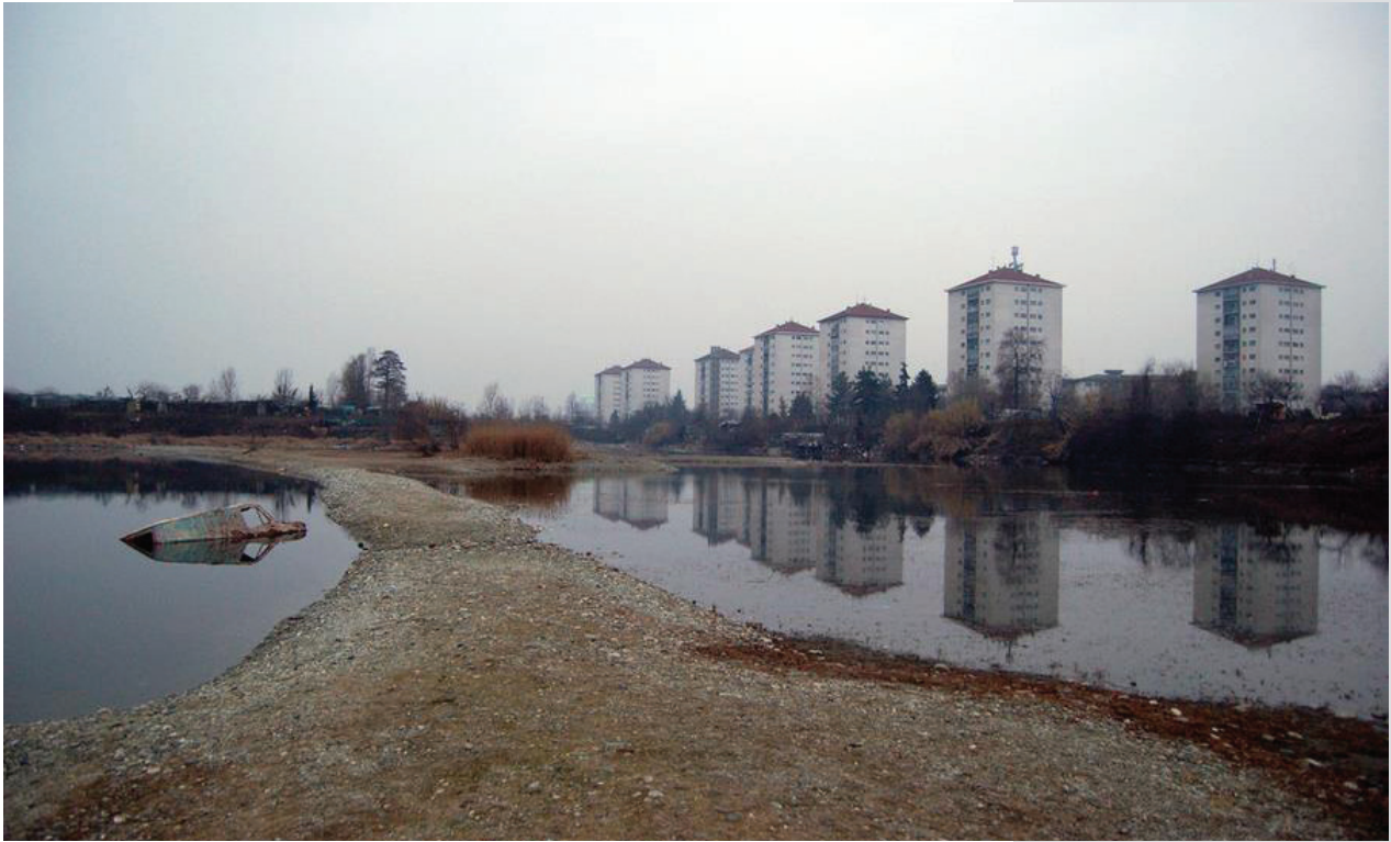
Figure 2. Falchera nuova.