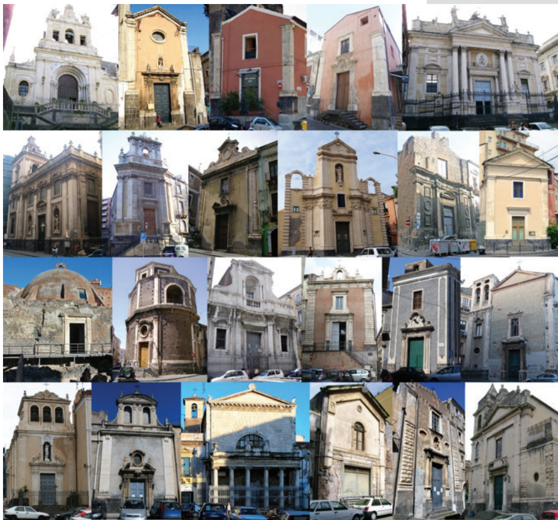
Figure 1. The facades of the twenty-three single hall churches in Catania. On the top, from left to right: S. Agata al Carcere, S. Agata alle Sciare, S. Antonio Abate, S. Barbara, S. Biagio, S. Caterina al Rinazzo, S. Cristoforo Minore, S. Giuseppe al Duomo, S. Giuseppe al Transito, S. Maria della Palma, S. Maria della Consolazione al Borgo, S. Maria della Rotonda, S. Maria dell'Ogninella, S. Martino dei Bianchi, S. Michele Minore, S. Nicolò al Borgo, S. Orsola, S. Sebastiano, S. Vito, SS. Crocifisso di Majorana, SS. Elena e Costantino, SS. Sacramento al Borgo, SS. Sacramento al Duomo.

complesso termale di epoca romana, e due casi in cui i templi sono stati ridestinati al culto: quello ortodosso per la locale comunità rumena presso la chiesa di S. Cristoforo Minore e quello cattolico per la comunità cingalese nella chiesa di S. Maria dell'Ogninella [5]. Dal punto di vista tipologico queste fabbriche tradizionali hanno caratteristiche simili. La navata unica, sormontata da una volta a botte lunettata, è generalmente conclusa da un'abside semicircolare chiusa superiormente da un catino emisferico. Le superfici utili delle aule oscillano tra gli 85 ed i 280 metri quadrati, alle quali vanno poi sommate le piccole superfici costituite dagli ambienti di servizio annessi che sono presenti in gran parte delle chiese analizzate. Per il riconoscimento delle caratteristiche tecnico-costruttive si è proceduto al rilievo di tutti gli elementi di fabbrica. In particolare, si è riscontrato che le chiusure verticali, di spessore variabile tra 60 e 160 centimetri, sono formate da murature portanti in blocchi informi o sbazzati di basalto lavico e malta di calce