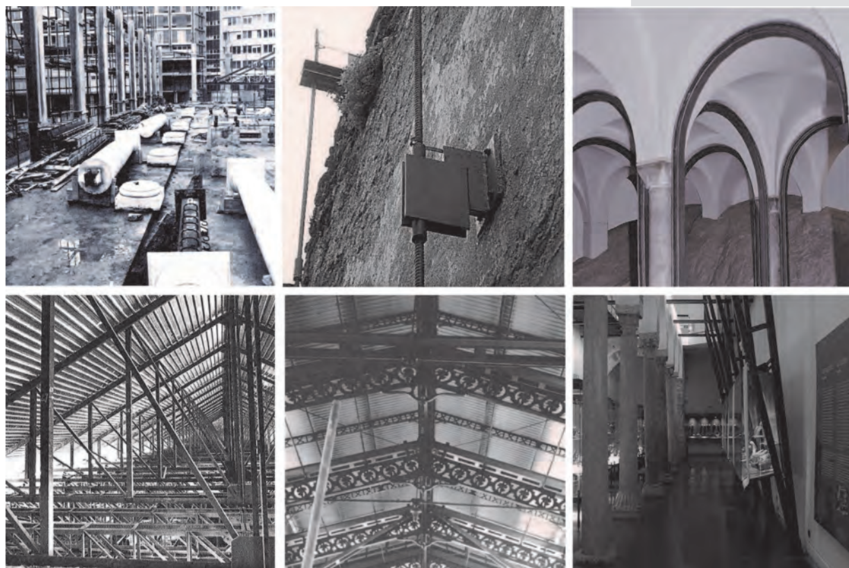
Figure 2. Dissimulation Gradient: total by material subtraction or addition camouflage, whispered by neutral or mimetic addition, denied by structural prosthesis or formal structures.

metallici sono posti a vista, con il compito di soddisfare non solo le esigenze strutturali, ma anche quelle figurative dell'edificio. Di conseguenza l'acciaio è impiegato rispettando non solo le leggi della statica, ma anche le proporzioni e i ritmi dell'antico, ovvero le regole architettoniche che ne