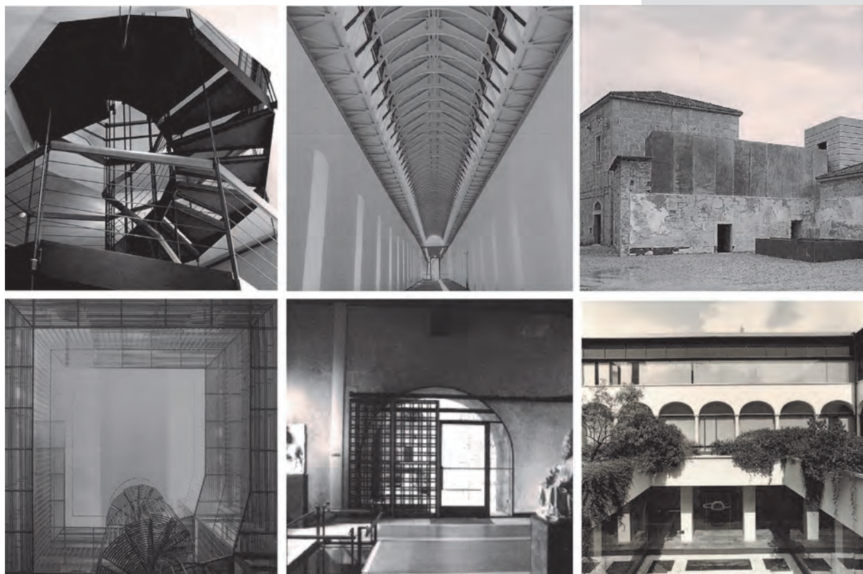
Figure 3. Highlighting Gradient: by single or dilated items, by repeated or multiple elements, by a system of fragments or extruded volumes.

Lo svelamento diffuso ricorre anche ad elementi metallici molteplici che, pur preferendo la variazione alla ripetizione, sono percepiti come parte di un disegno progettuale unitario. Nel Museo di Castelvecchio a Verona (Carlo Scarpa, 1956), una lunga trave di ferro passa continua lungo l'edificio, tentando di superare l'originale rigidità del sistema spaziale: composta da profili binati, la trave rifiuta l'uso di componenti standardizzate e propone un profilo a C con piatti in acciaio, imbullonati ad un profilo angolare alle estremità superiore ed inferiore. Una particolare attenzione è posta di nuovo al giunto di intersezione tra la trave e le pareti divisorie: la prima riduce la sua sezione resistente in corrispondenza delle pareti, le seconde ridisegnano il proprio profilo sottraendo materia in corrispondenza del punto di contatto. Oltre a modificare l'articolazione degli spazi interni, l'acciaio disegna la copertura con le travi lignee di colmo esistenti e configura le connessioni dialogando con il cemento armato delle passerelle. La presenza dell'acciaio è in Castelvecchio estesa all'intero complesso in diverse forme, sempre in vista, integrate con altri materiali: l'accostamento con essi racconta storie altrettanto variegata che avvicinate, ma dissociate, iniziano a dialogare [17]. Un dialogo, questo, che mette a sistema materia antica ed acciaio, facendo