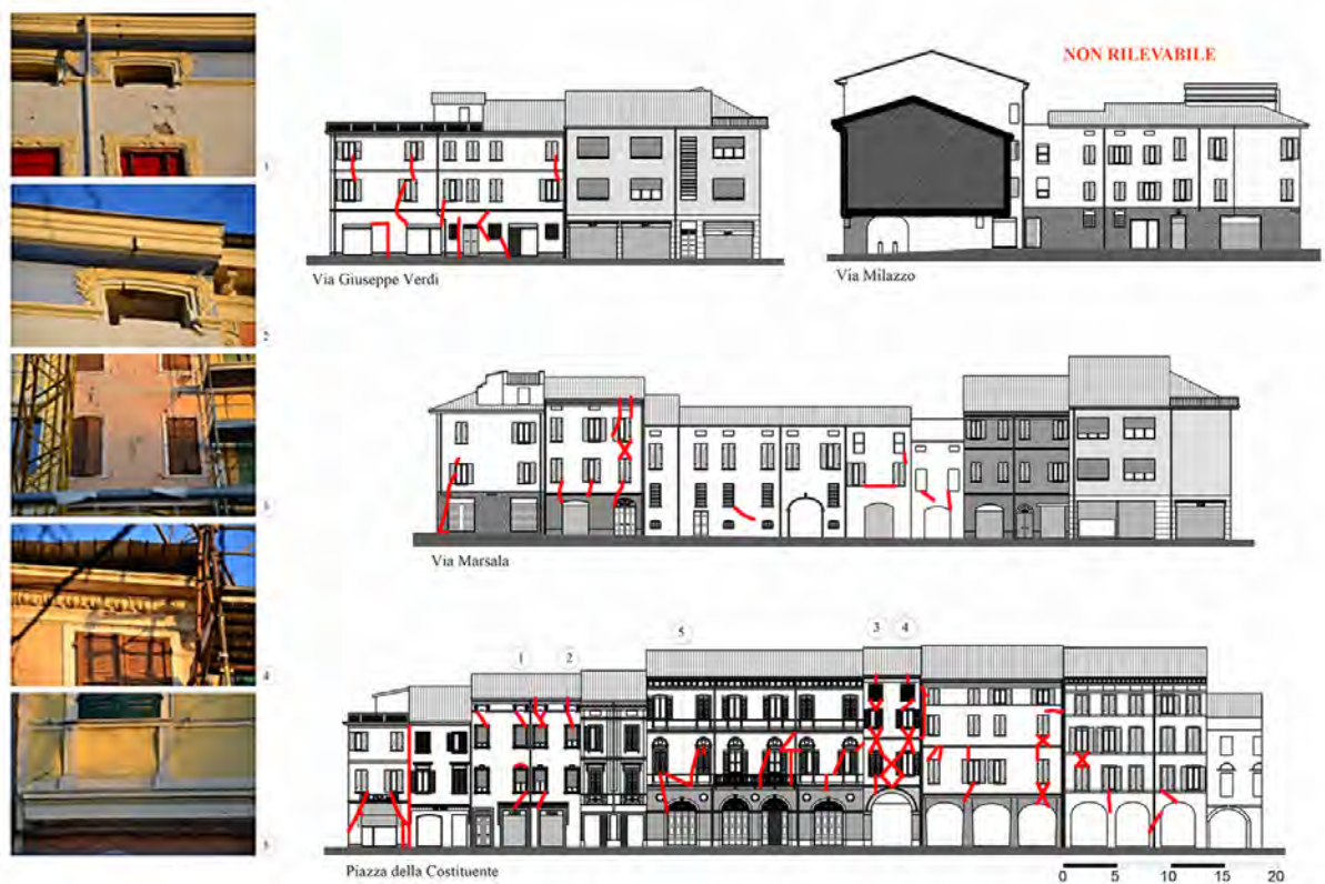
Figure 3. Survey of the real damage on the façades.

In merito invece ai cosiddetti cinematici di primo modo, e cioè nella previsione del comportamento per