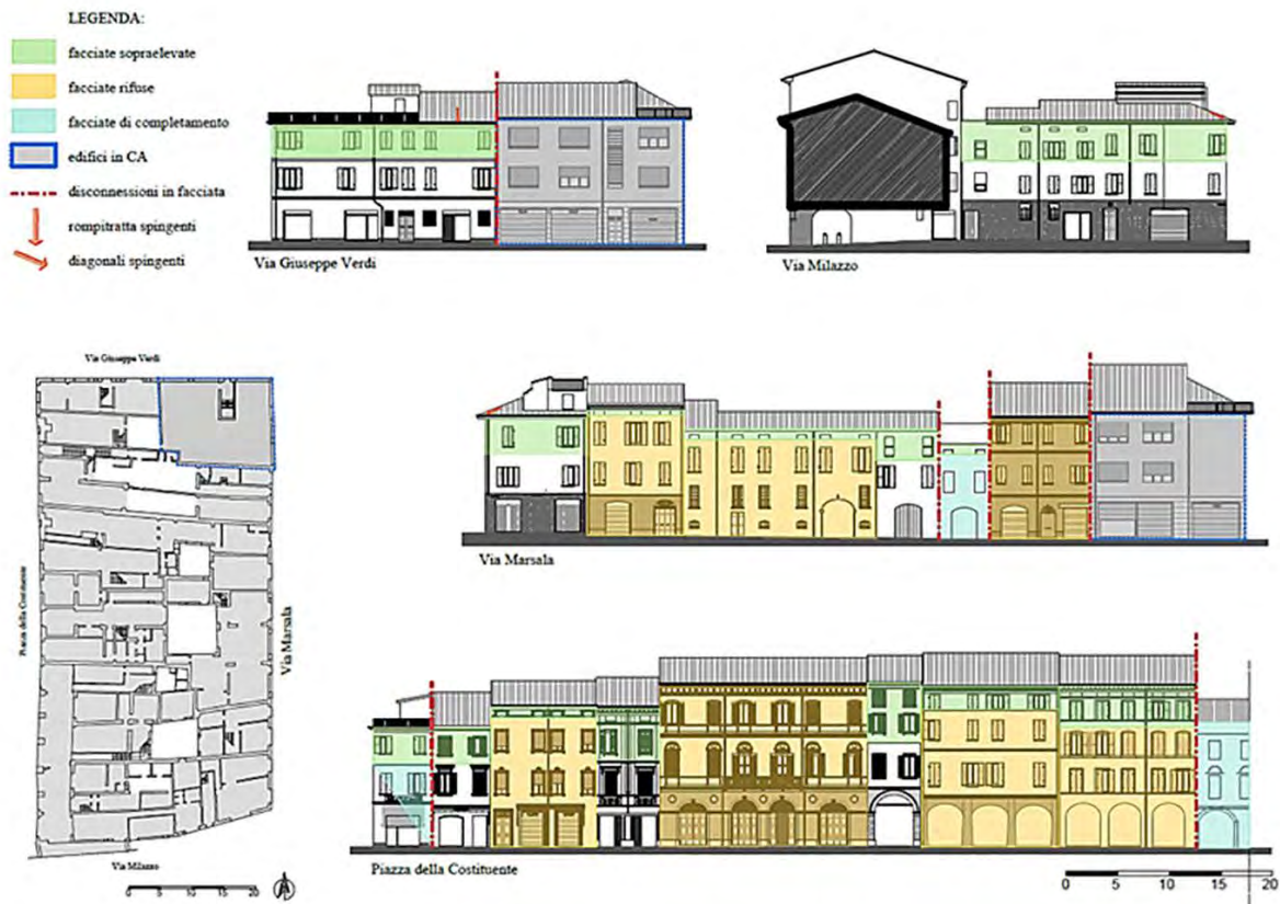
Figure 1. Example of graphical representation of the façades transformation phases.

vulnerabilità dei singoli aggregati. Tale vulnerabilità è stata definita attraverso alcuni indicatori i quali sono ritenuti significativi in ragione della loro relazione causale con il danneggiamento: ribaltamento delle facciate, ribaltamento dei timpani, lesioni per spinta da falsi puntoni, martellamento per irregolarità costruttive (presenza nell'aggregato di edifici in c.a., solai sfalsati tra due edifici adiacenti), debole resistenza a